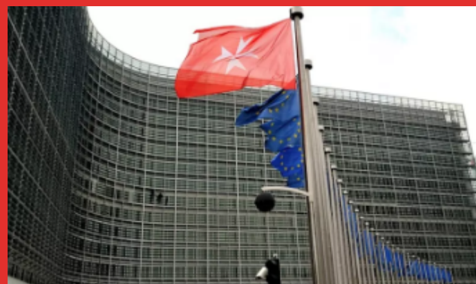
FOTO: Vlajka Maltézskeho rádu pred sídlom Európskej komisie, Brusel