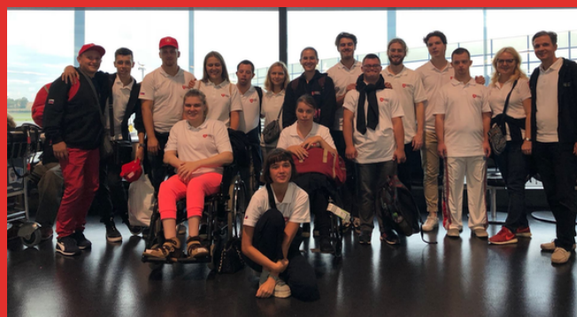
FOTO: Letný tábor pre mladých so zdravotným znevýhodnením