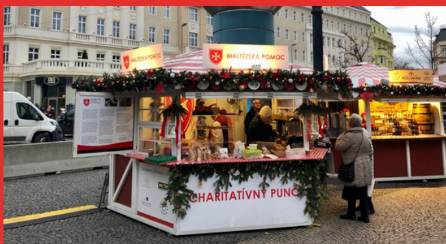
FOTO: Charitatívny vianočný punč, Vianočné trhy, Bratislava