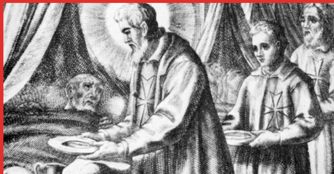
FOTO: Prevádzka prvej nemocnice maltézskeho rádu, 11. storočie, Jeruzalem