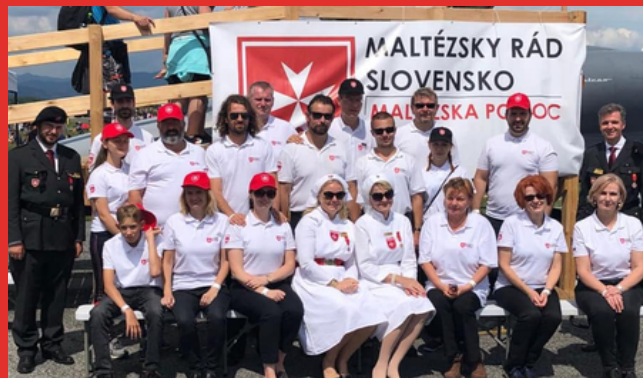
FOTO: Dobrovoľníci v službe pri prevádzke sektora pre ľudí s hendikepom

Mimo pravidelných aktivít pomáhame vždy, keď je to možné a potrebné – boli sme na hraniciach počas utečeneckej krízy, asistujeme v nemocniciach počas pandémie COVID-19 a dodávame chýbajúci zdravotnícky materiál.