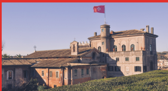
FOTO: Aktuálne hlavné sídlo Maltézskeho rádu sa nachádza v Ríme