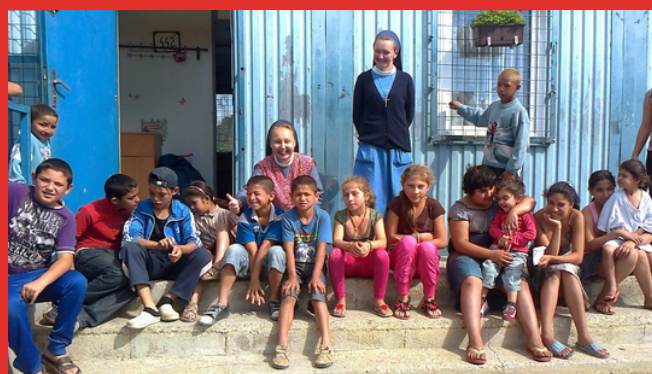
FOTO: Stály projekt MPS starostlivosti o rómske deti v komunitnom centre, Orechov dvor Nitra.