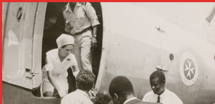
FOTO: Zdravotná pomoc počas Prvej svetovej vojny